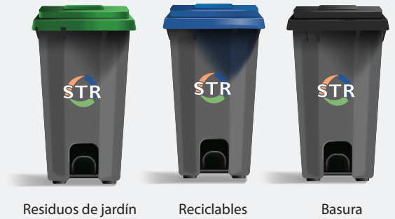
Residuos de jardín

Asegúrate de "Verificar la Tapa" para obtener instrucciones sobre cómo utilizar los contenedores correctamente y evitar la contaminación.