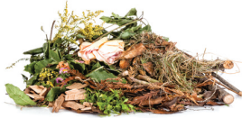
LOS RESIDUOS DE JARDÍN