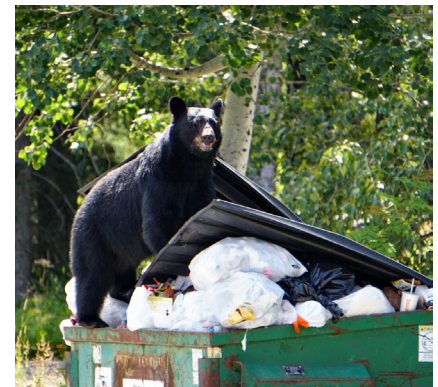
No sobrecargue los contenedores, consulte la página 5 para saber qué hacer con los residuos adicionales.