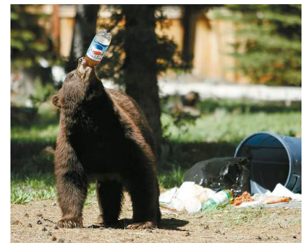
No deje los contenedores afuera la noche anterior, los contenedores deben estar afuera a las 7 am.