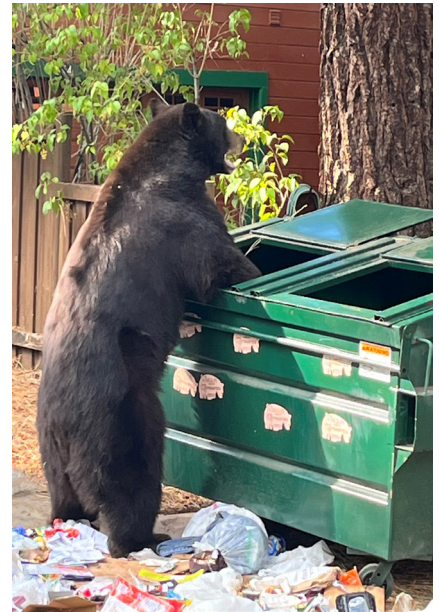
Asegúrese siempre de que las tapas de los contenedores estén cerradas y bloqueadas.

Obtenga información adicional de nuestros expertos locales en el Tahoe Interagency Bear Team en TahoeBears.org